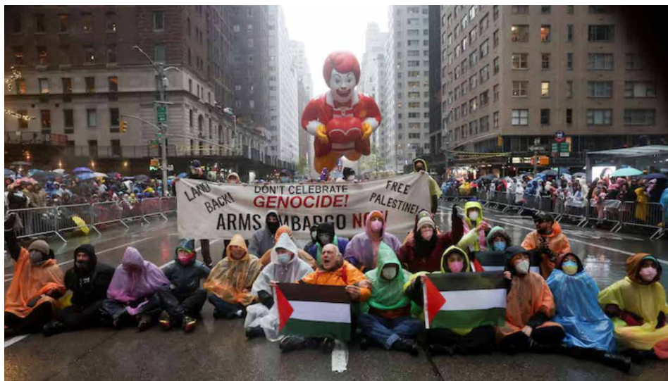
Nov. 28, 2024 protest, New York City, during the 'Thanksgiving' parade.

Such a defeat for Zionism will strike a significant blow to a dying U.S. empire. Imperialism and Zionism are already feeling the impact of the heroic Palestinian resistance which they have utterly failed to crush. □