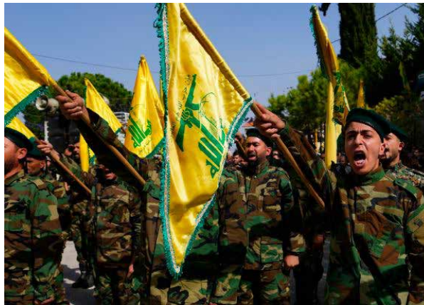
Combatientes de Hizbulá.

«Hizbulá, a pesar de los grandes sacrificios, conserva el mando y el control total, como demuestra su capacidad para atacar “Tel Aviv” y Haifa hace dos días. Mientras tanto, el ministro de Defensa sionista rechazó hace unos momentos las recomendaciones de volver a la escolarización en los Altos del Golán y en los asentamientos fronterizos, a pesar del alto el fuego, lo que subraya la continua inseguridad.» (27 de noviembre)