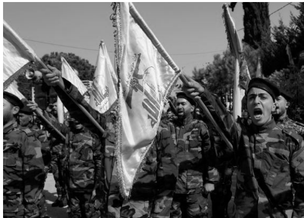
Combatientes de Hizbulá.

«Hizbulá, a pesar de los grandes sacrificios, conserva el mando y el control total, como demuestra su capacidad para atacar “Tel Aviv” y Haifa hace dos días. Mientras tanto, el ministro de Defensa sionista rechazó hace unos momentos las recomendaciones de volver a la escolarización en los Altos del Golán y en los asentamientos fronterizos, a pesar del alto el fuego, lo que subraya la continua inseguridad.» (27 de noviembre)