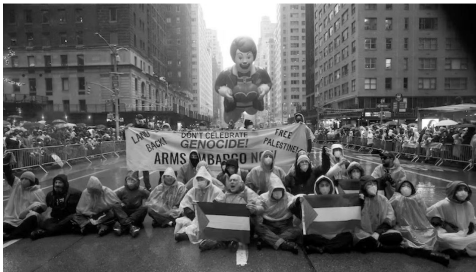
Nov. 28, 2024 protest, New York City, during the 'Thanksgiving' parade.

Such a defeat for Zionism will strike a significant blow to a dying U.S. empire. Imperialism and Zionism are already feeling the impact of the heroic Palestinian resistance which they have utterly failed to crush. □